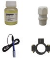
Повна поставка обладнання Complete equipment supplied

EZ DUO - це повноцінний сольовий хлоратор з вбудованою системою регулювання рН, необхідної для ефективного очищення води.