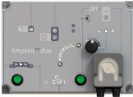
Передній дозуючий насос з добовим лімітом дозування In-front dosing pump with daily dosing limit