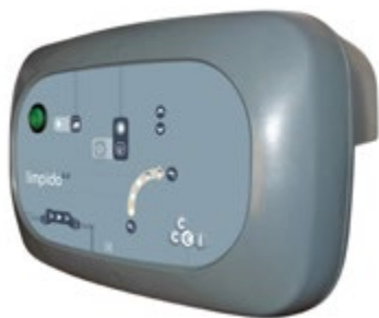
Панель сольового хлоратора Limpido EZ Limpido EZ salt chlorinator panel

Розумне сольве хлорування продумано для професіоналів Smart salt chlorination thought out for professionals !