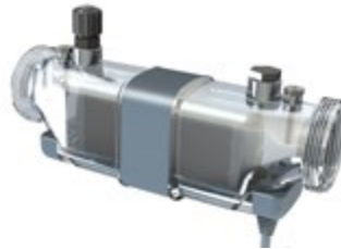
Осередок хлоратора та сполучна коробка Chlorination cell and connexion box